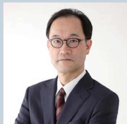
【講師プロフィール】

今回は、大学からみた産学連携の状況をお話すると共に、抱える課題についても掘り下げます。京都大学と連携する企業は、ベンチャー、中小企業から大企業まで幅が広く、それぞれニーズも、傾向も異なっています。企業からみて、大学の成果や研究者の知見をどのように活用していけばいいかという視点で議論していただきます。